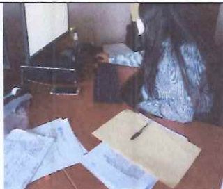
Redacción de Justificación para colocar en recibos de pago